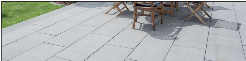
Silkstone-RSF 3 grau