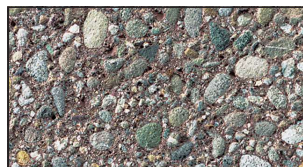
SG 8/16 braun