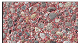
SG 8/16 rot