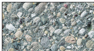
SG 8/16 grau