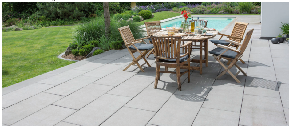
Silkstone-RSF 3 grau